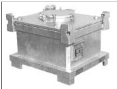
Typ DC 450