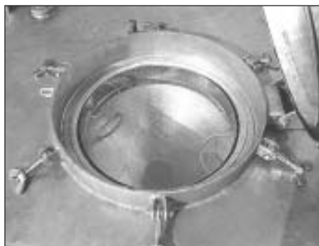
Einfüllöffnung mit Trichter und Sieb