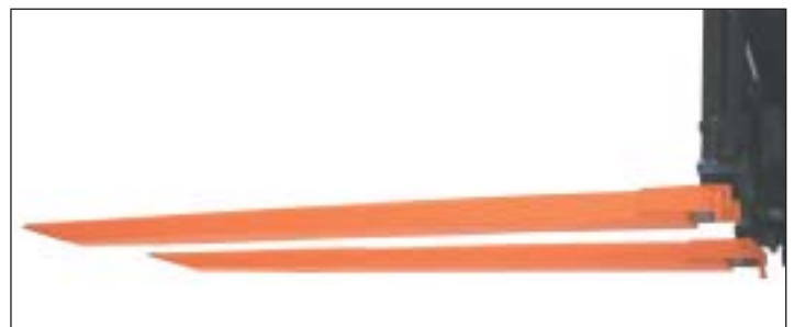
Typ GG geschlossene Ausführung (Kastenprofil) mit Bolzensicherung