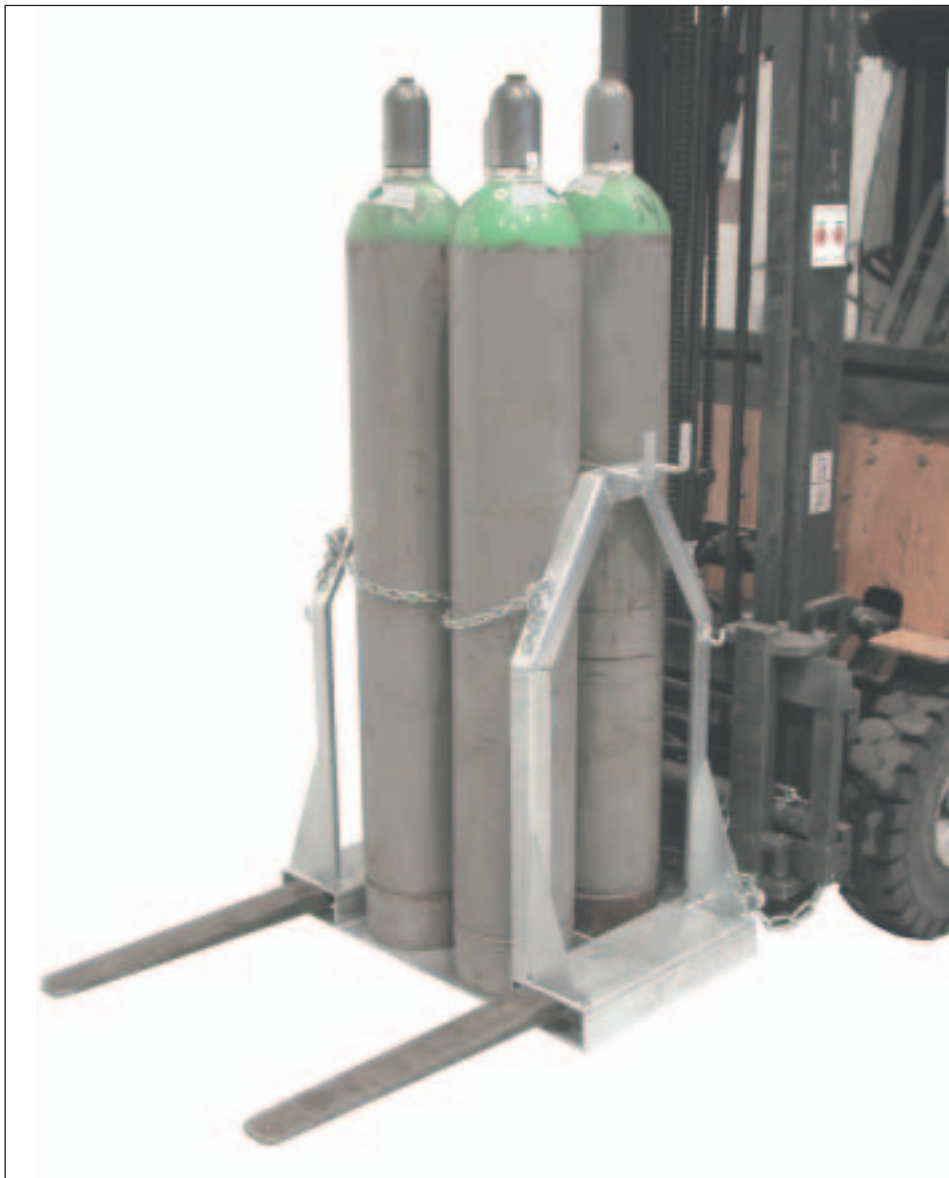
Typ SFP 4

Für den sicheren, wirtschaftlichen und kraftschonenden Transport von 1 bis 8 Stahlflaschen