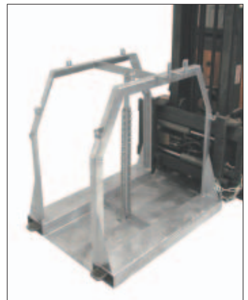
Typ SFP 8