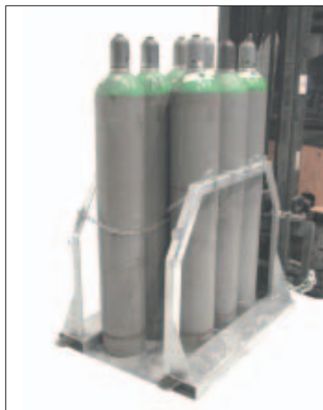
Typ SFP 8