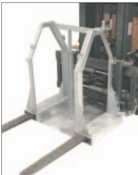
Typ SFP 4