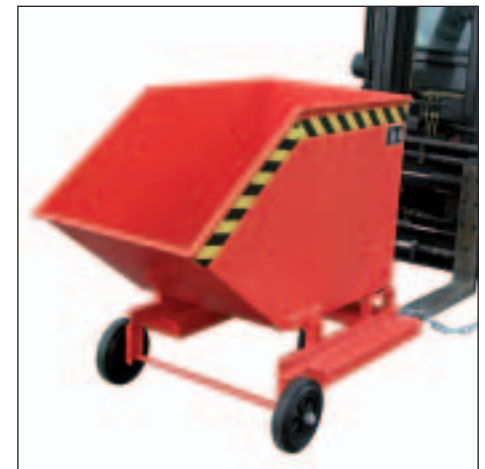
in verschiedenen RAL-Farben lieferbar