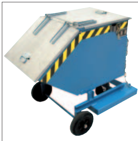
Typ KW mit Einfahrtaschen und Deckel