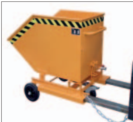
Sicherungskette, Federkippsicherung und Ablasshahn 1"