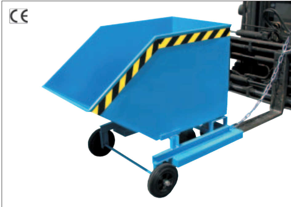
Typ KW mit Einfahrtaschen