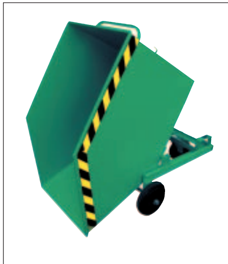
Typ KW ohne Einfahrtaschen