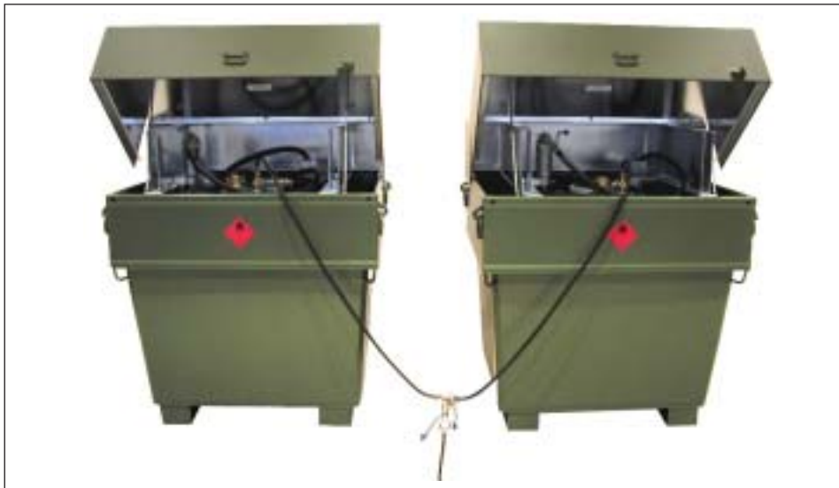
Typ MW als „kommunizierendes System“