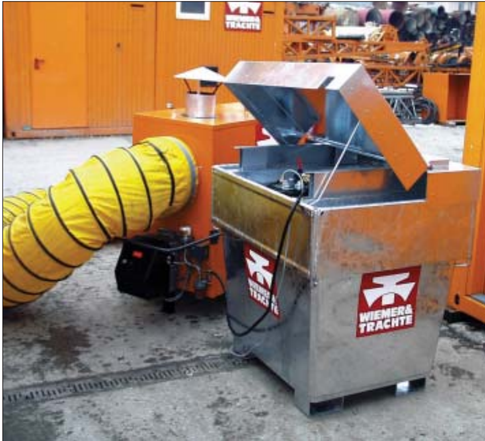
Typ MW 800, Versorgung eines Warmluftheizgerätes mit Heizöl