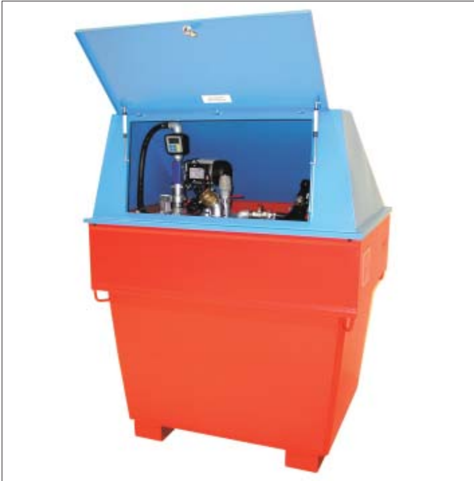
Typ MD 800