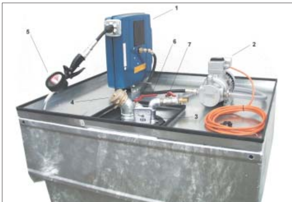
Typ MO 800 im Detail