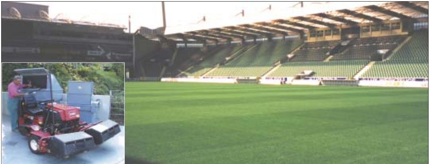
Versorgung von Rasenmähern zur Pflege von z.B. Fußballplätzen und Golfanlagen