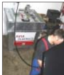
mobile Ölversorgung in KFZ-Werkstatt