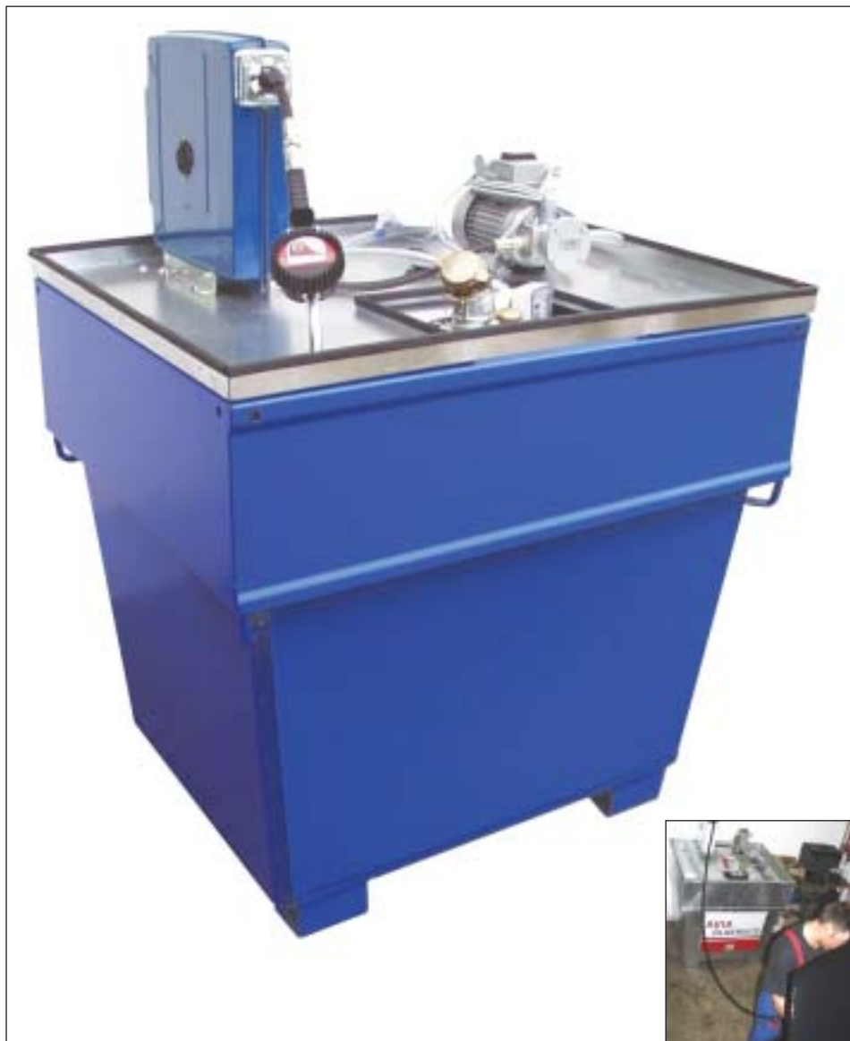
Typ MO 800