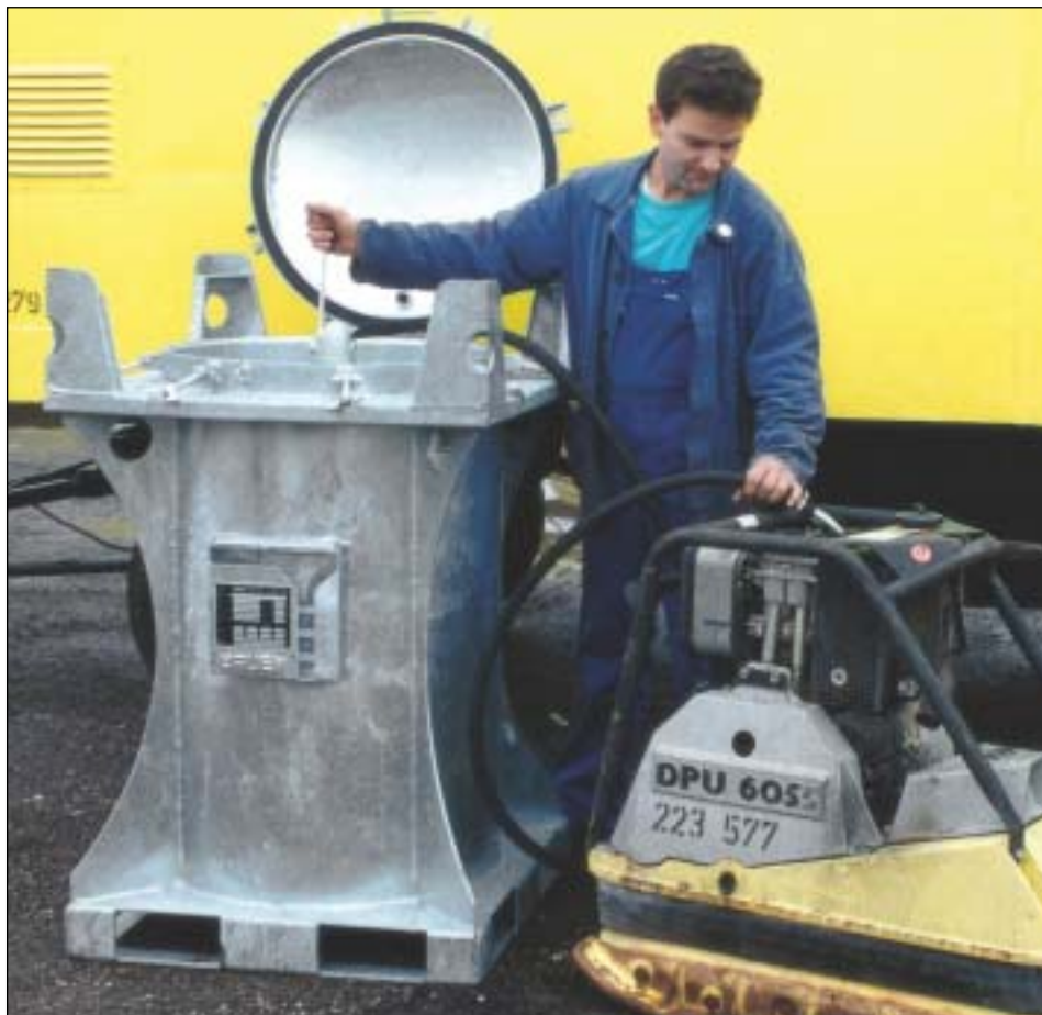
Typ MT 235 mit Handpumpe