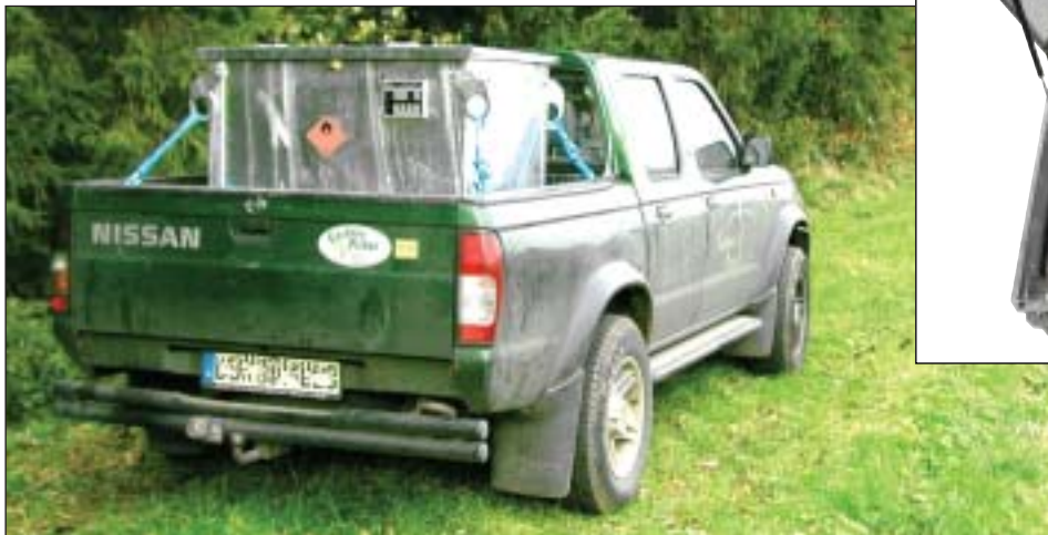
Typ MT 450, passt auch auf jeden Pick-up!