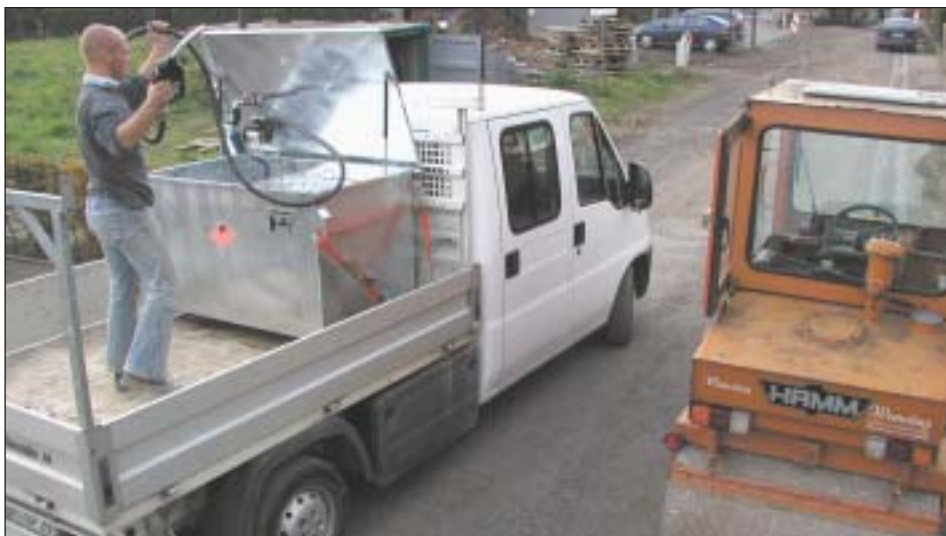
Typ MT 600 auf Pritschenwagen