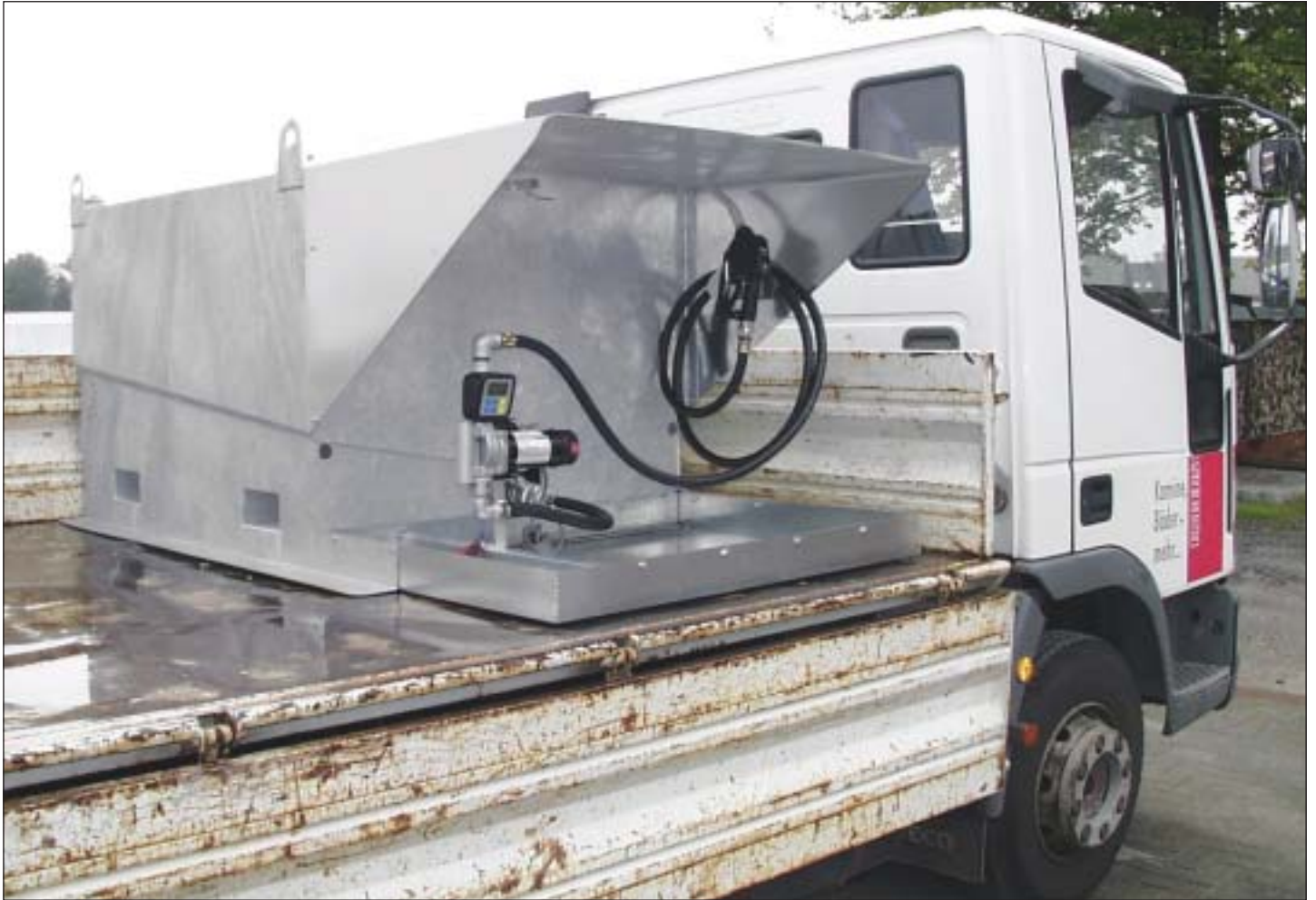
Typ TC 1000 mit Pumpenanschluss am Bodenauslauf