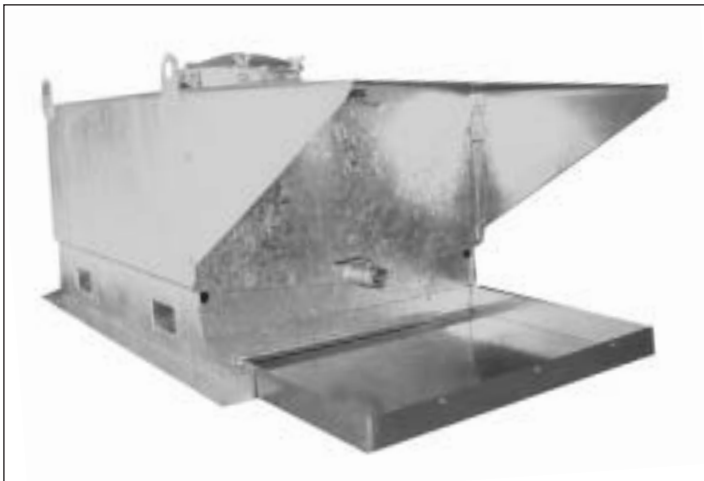
Typ TC 1000