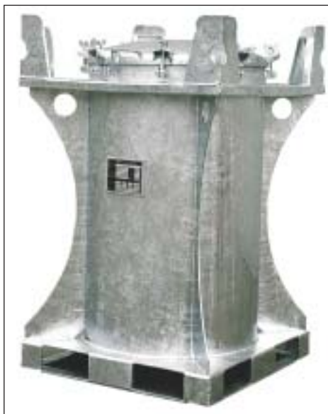
Typ MT 235

Alle Armaturen sind unter dem abschließbaren Deckel angebracht und vor unbefugtem Zugriff gesichert.