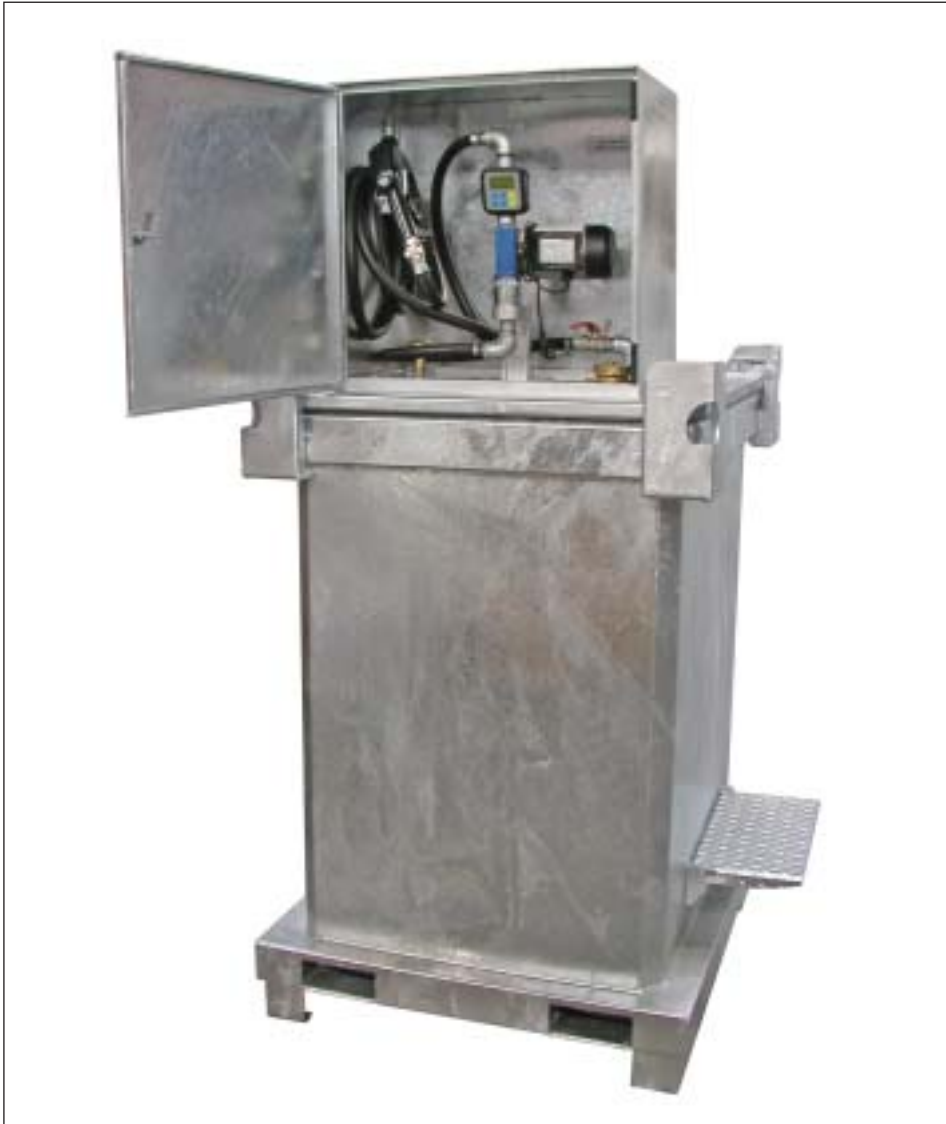
Typ DT 1000 mit Elektropumpe