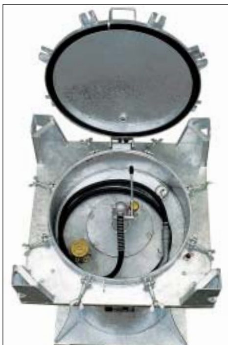
Handpumpe, Befüllstutzen, Füllstandanzeige, Belüftungsventil