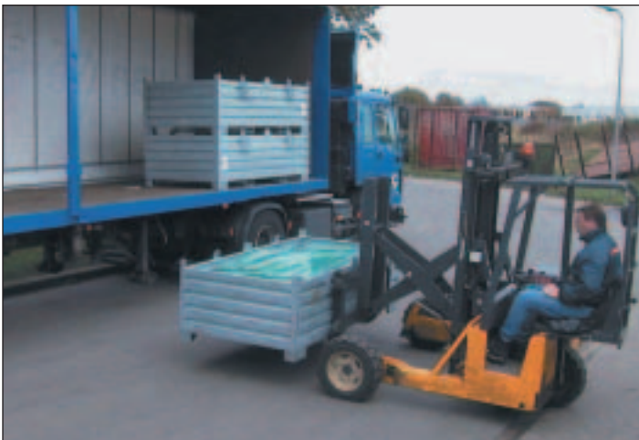
einsetzbar z.B. für die Sammlung von Flachglas