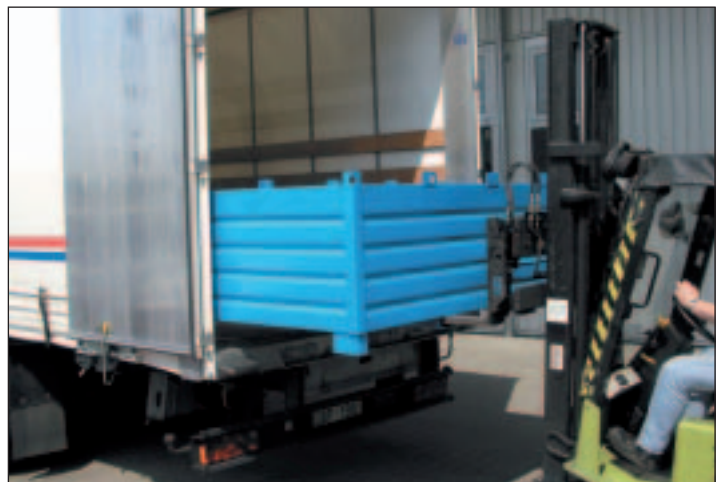
Optimale Ausnutzung der Ladefläche