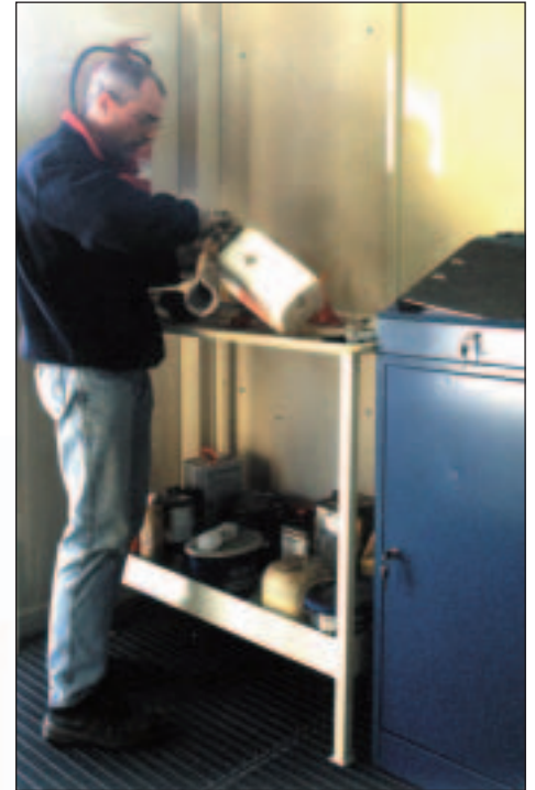
Umfülltisch und Schreibtisch