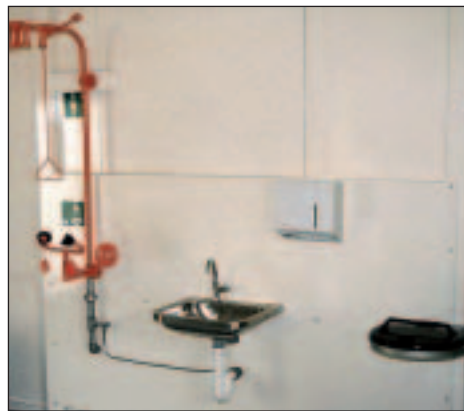
Notdusche und Sanitärbereich