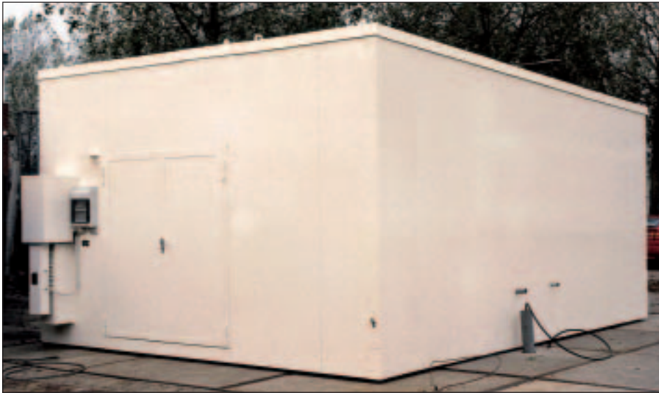
Sammelstelle in Modulbauweise