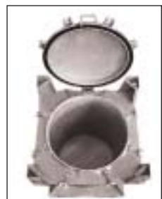
Typ SC und Trichter mit Füllrohr und Sieb