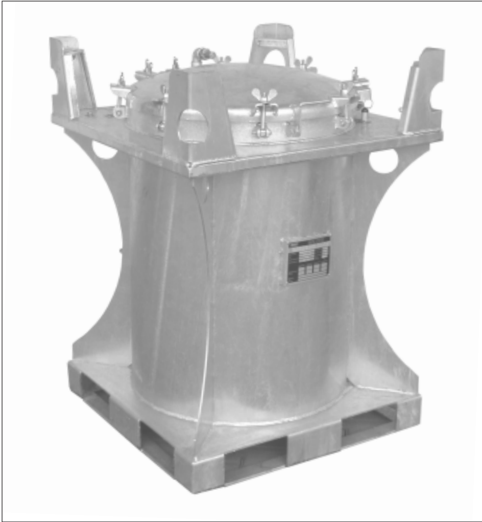
Typ SCD 240