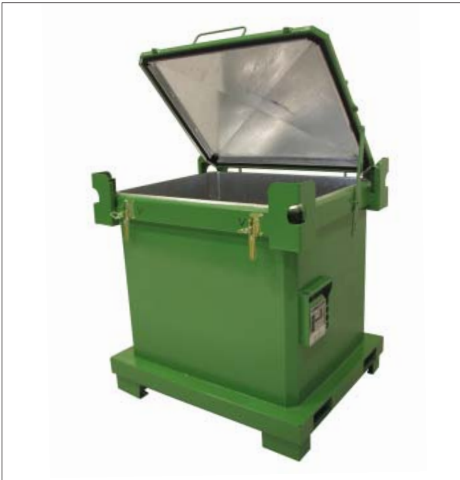
Typ SAP 800-1 mit zusätzlicher Außenlackierung, Deckelstütze bei 70°