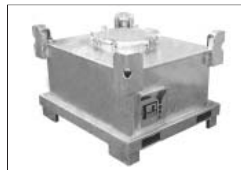
Typ SAF 450