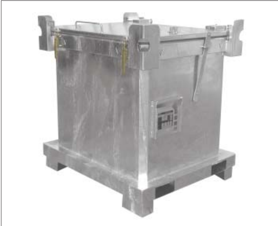
Typ SAP 800-1