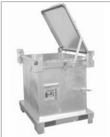
Deckelstütze bei 70°