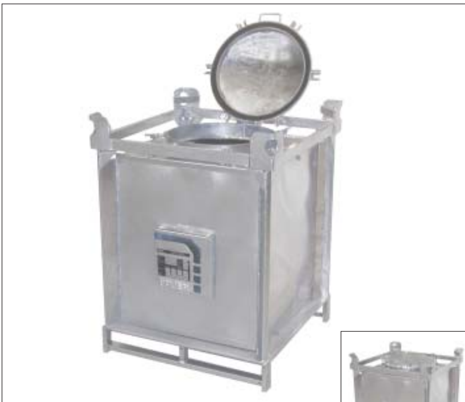
Typ SF 240