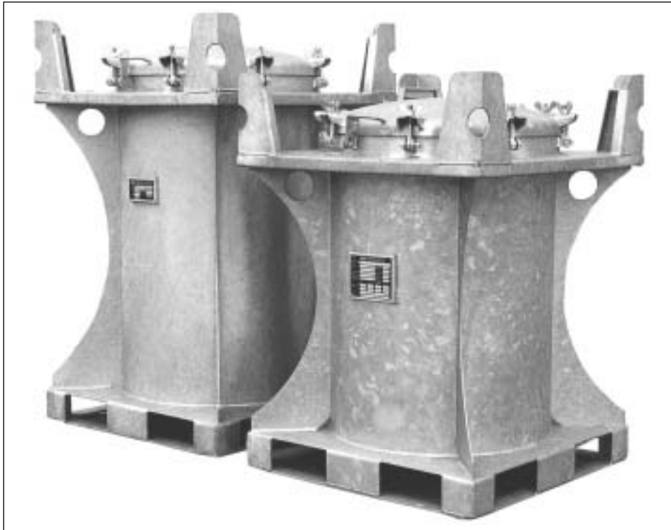
Typ SC 240 und Typ SC 285