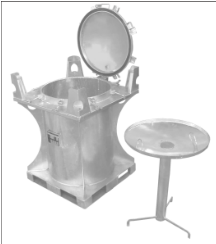
Typ SCD 240, Trichter mit Füllrohr und Sieb