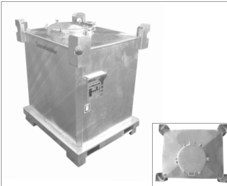
Typ SAF 1000 mit versetztem Domdeckel