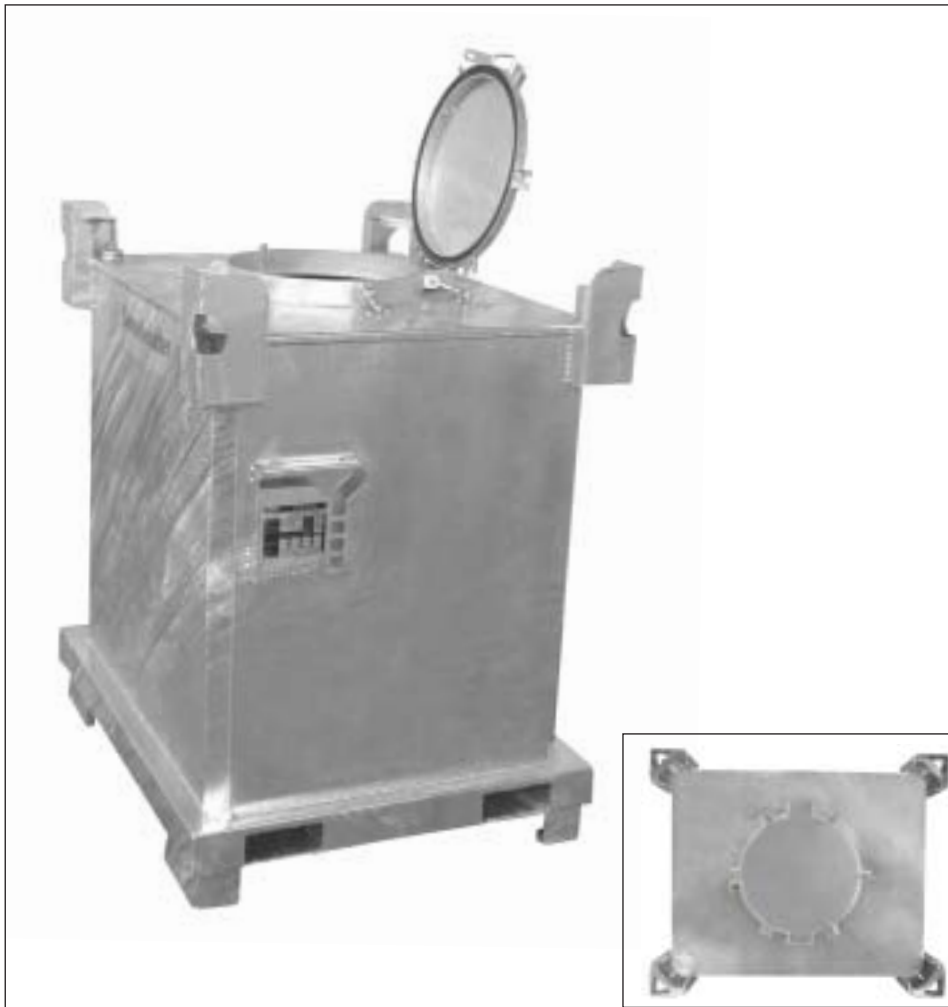
Typ SAF 1000