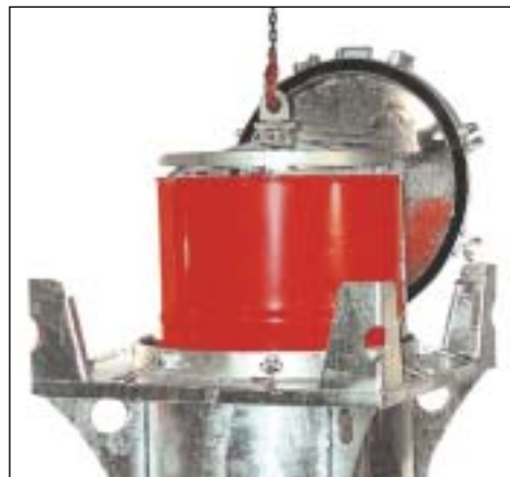
Fasstraverse Typ FT/M für Typ SC 285