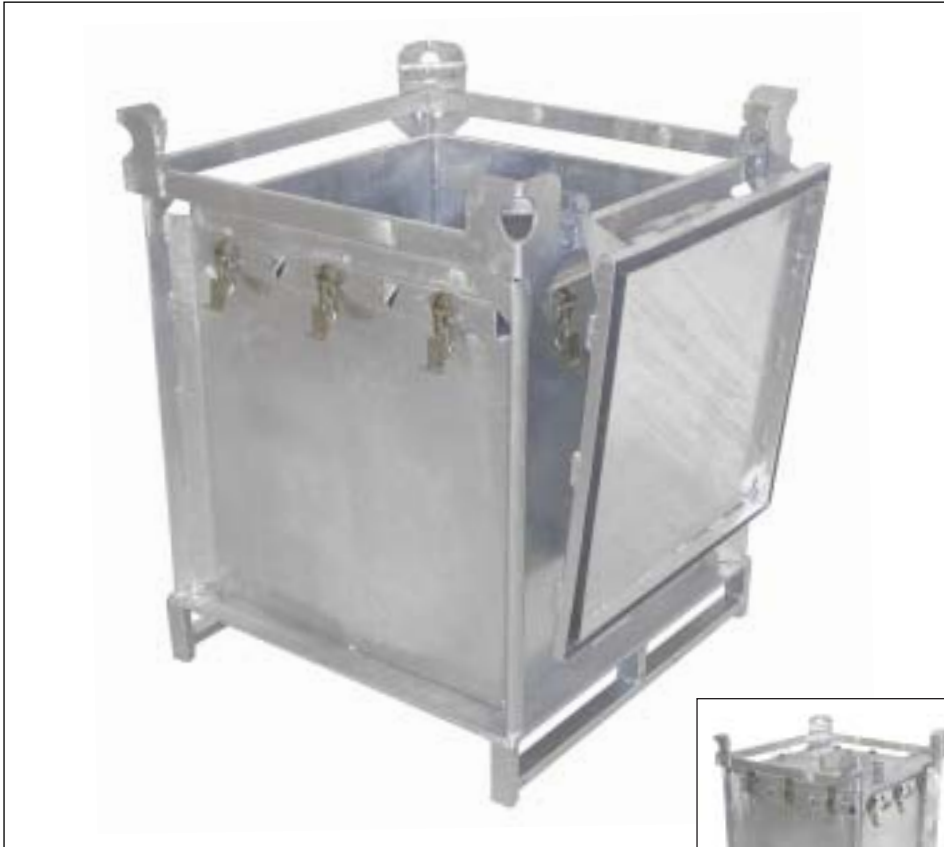
Typ SP 240