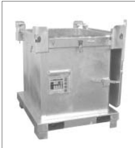
selbsttätige Deckelarretierung bei 270°