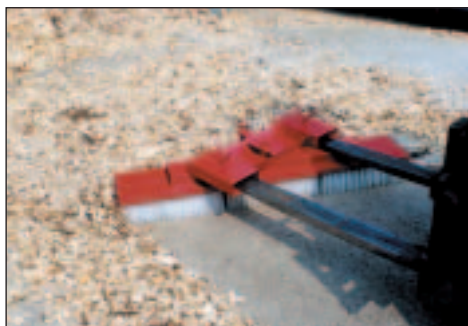
... in Rechtsstellung