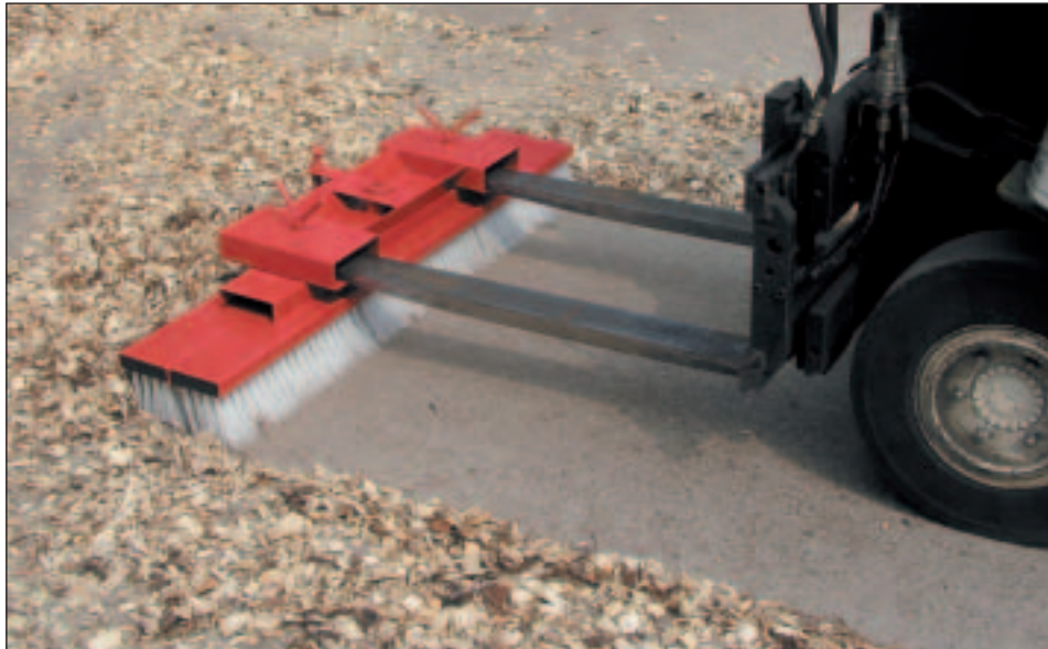
Typ SKB in Grundstellung