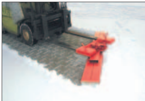
Typ SKB in Linksstellung