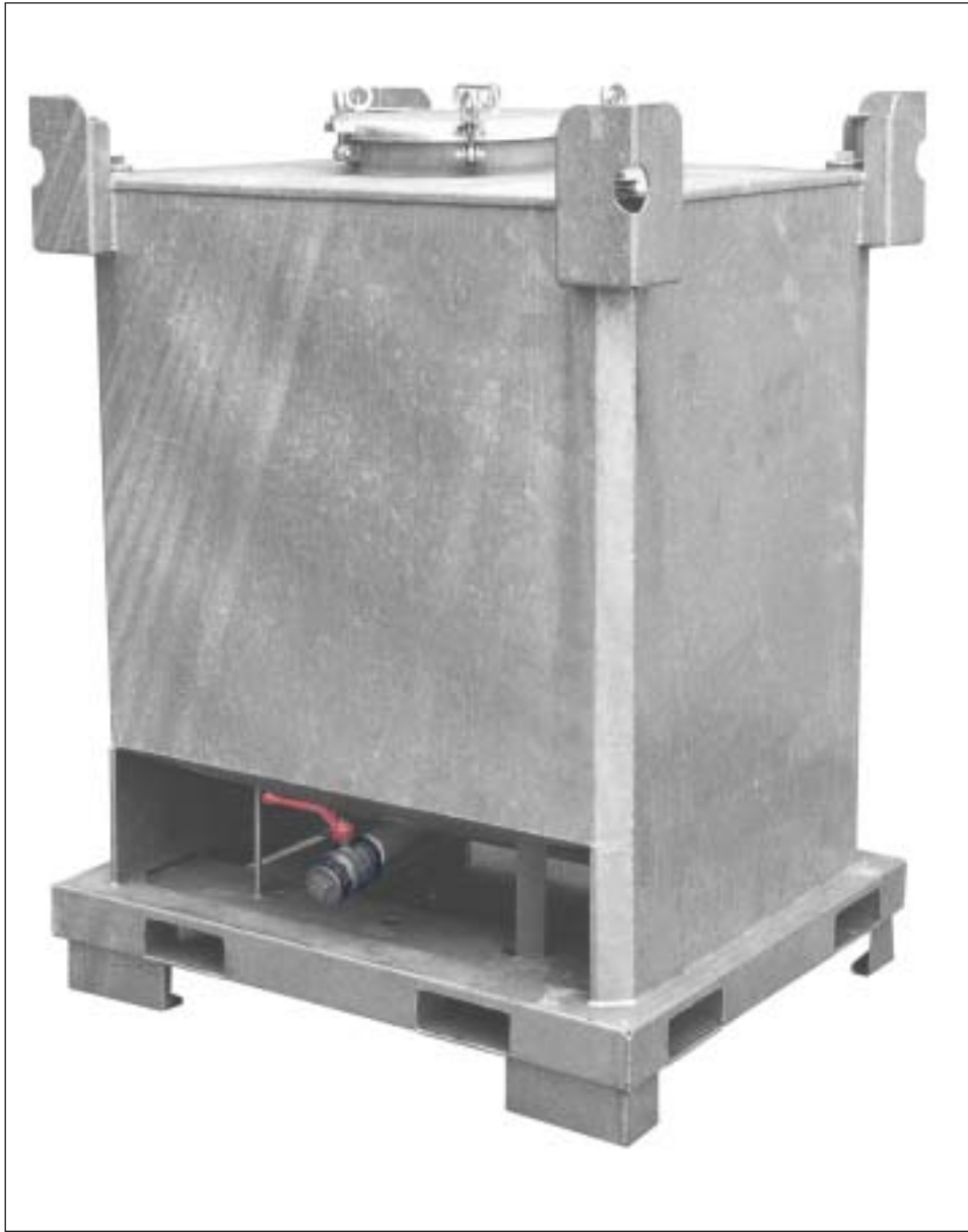
Typ TCB 1000