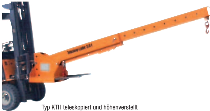
Typ KTH teleskopiert und höhenverstellt