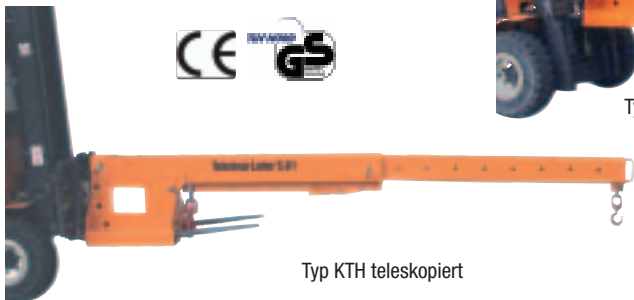
Typ KTH teleskopiert