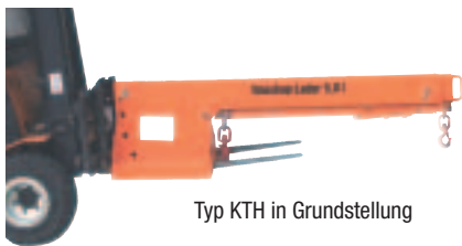
Typ KTH in Grundstellung