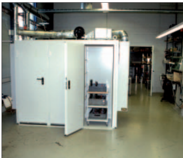
Typ WK zur Lagerung von Kondensatoren