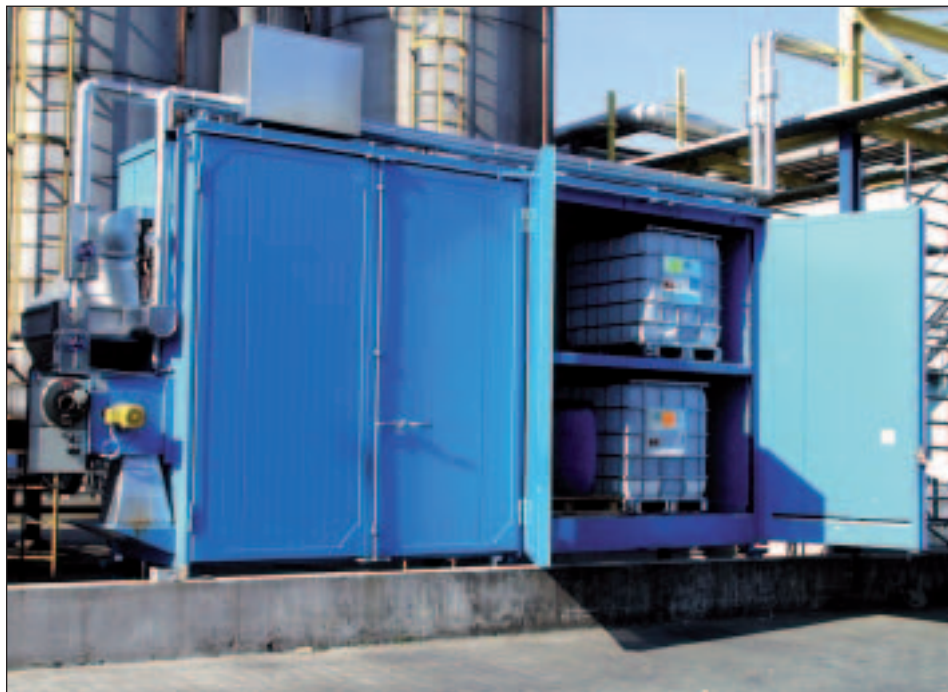
Typ WK zur Aufheizung von Aktivatoren für Produktionsprozesse